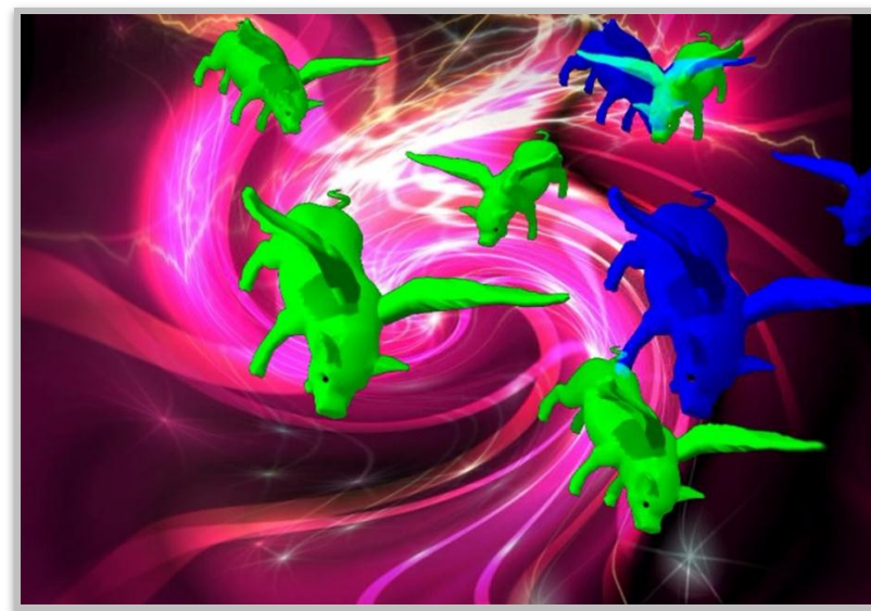
Images from the Video installation