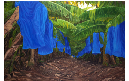
שרית אכמנברג , מרחפות שמן על בד, 240 × 160 2013