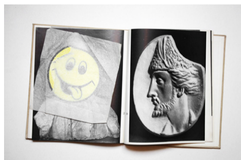
מרון שוב , סמיילי ונו מה שמו, מתוך סדרת סימניות בספרים, יפו, פברואר 2013, הורקת דיו על FineArt גודל A3, 2013