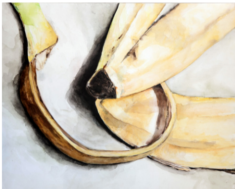
ענת גרינברג , הכל הבלים אקריליק על בד, 150 × 120 2015