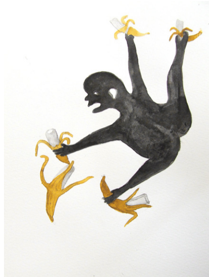
ציניל בנגה , ללא כותרת דיו הודי וצבעי מים על נייר, 15 × 21 2016