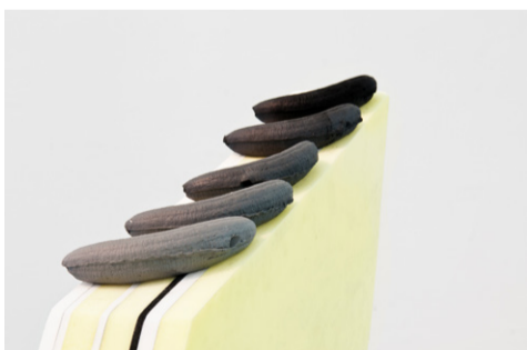
ליאור שחר , חמש על חמש טכניקה מעורבת - חמר, לוח מוקצף וקאפות, 100 × 120 × 10 2012