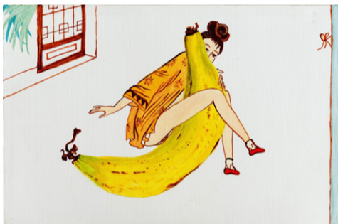
רחל רבינוביץ , בילוי עם בננה דיו ושמן על בד, 30 × 20 2001