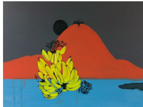
מוריה בכר , בננות והר אקריליק על בד, 120 × 100 2014