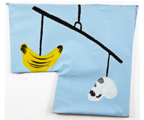
אלעד רוזן , דילמה אקריליק על בד, 100 × 100 2013