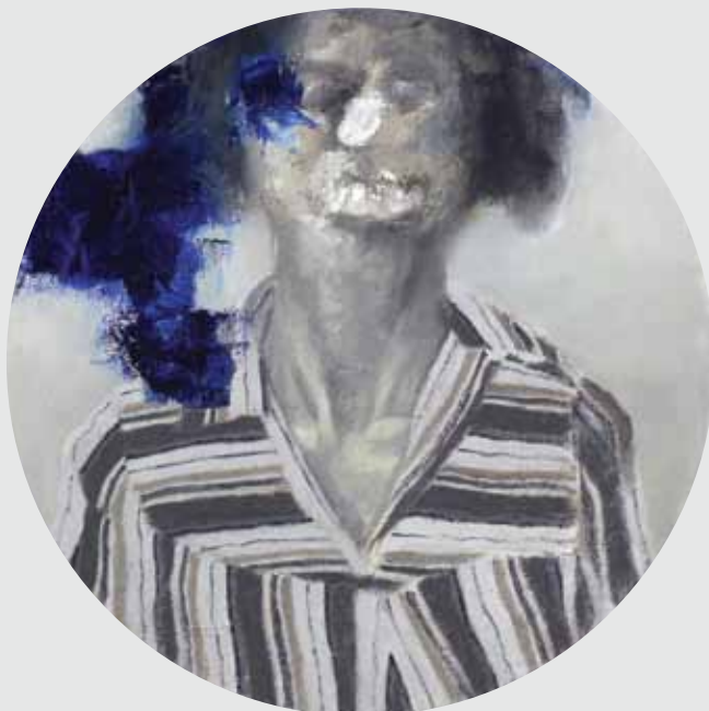
42x42 ס"מ | שמן על בד 42x42 cm | oil on canvas