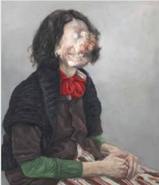
דיוקן עצמי 1 80x70 ס"מ | שמן על בד 80x70 cm | oil on canvas