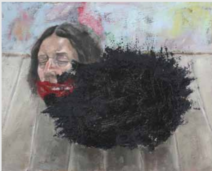
32x40 ס"מ | שמן על בד 32x40 cm | oil on canvas