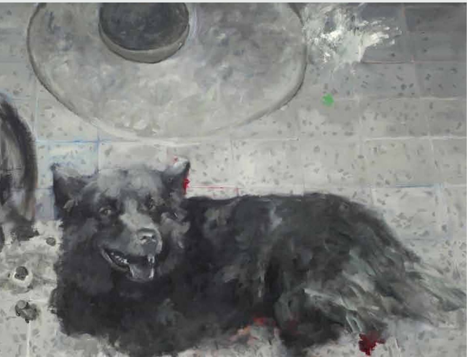
150x390 ס"מ | שמן על בד 150x390 cm | oil on canvas