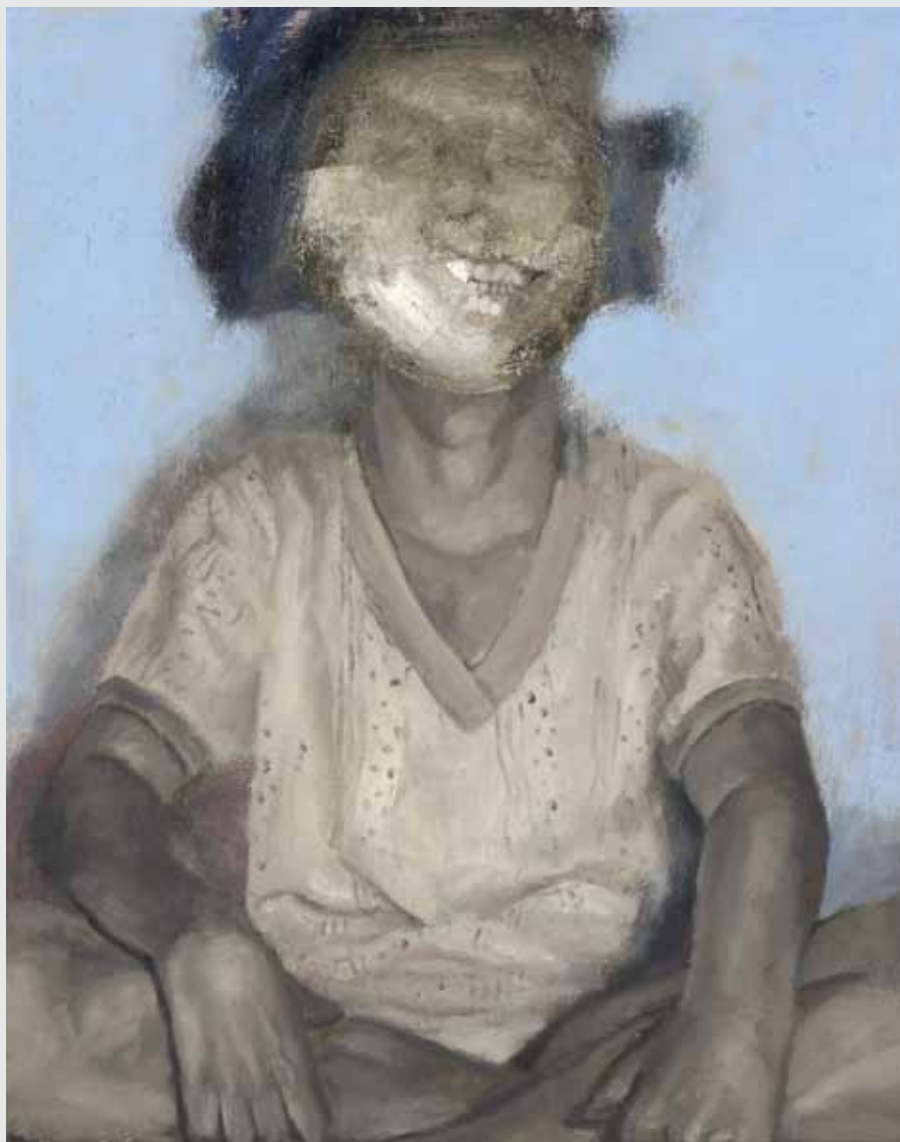
50x40 ס"מ | שמן על בד 50x40 cm | oil on canvas