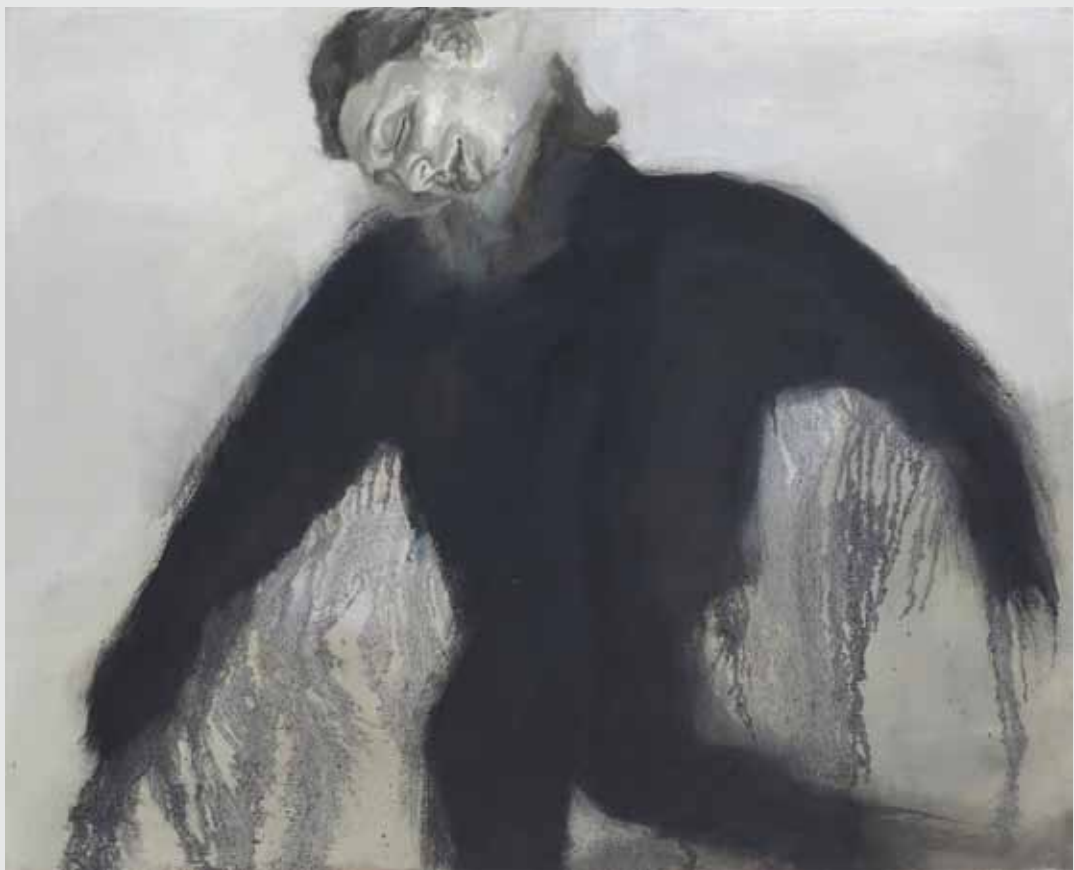
קייג קייג במצב שינה 60x75 ס"מ | שמן על בד 60x75 cm | oil on canvas