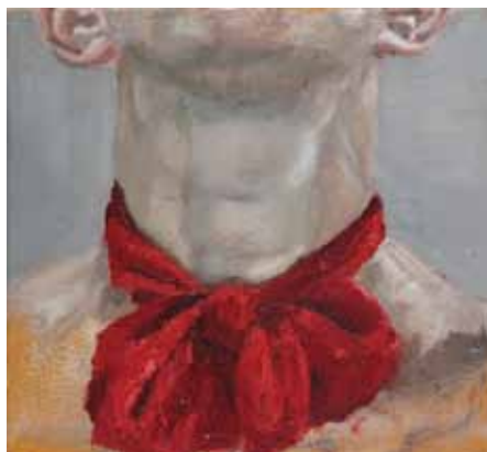
22x24 ס"מ | שמן על בד 22x24 cm | oil on canvas