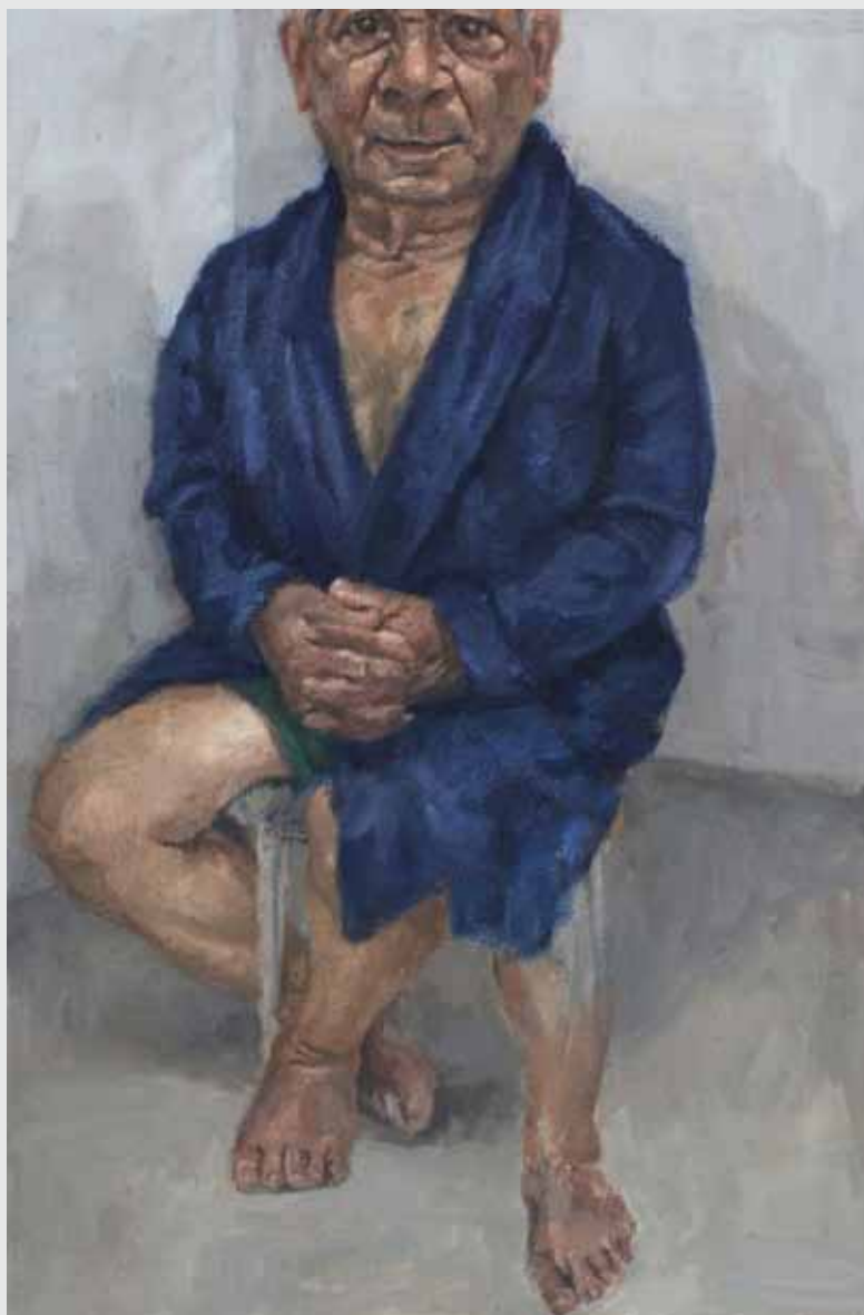
60x40 ס"מ | שמן על בד 60x40 cm | oil on canvas