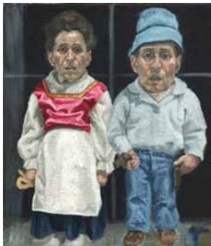
א-ני 40x35 ס"מ | שמן על בד 40x35 cm | oil on canvas