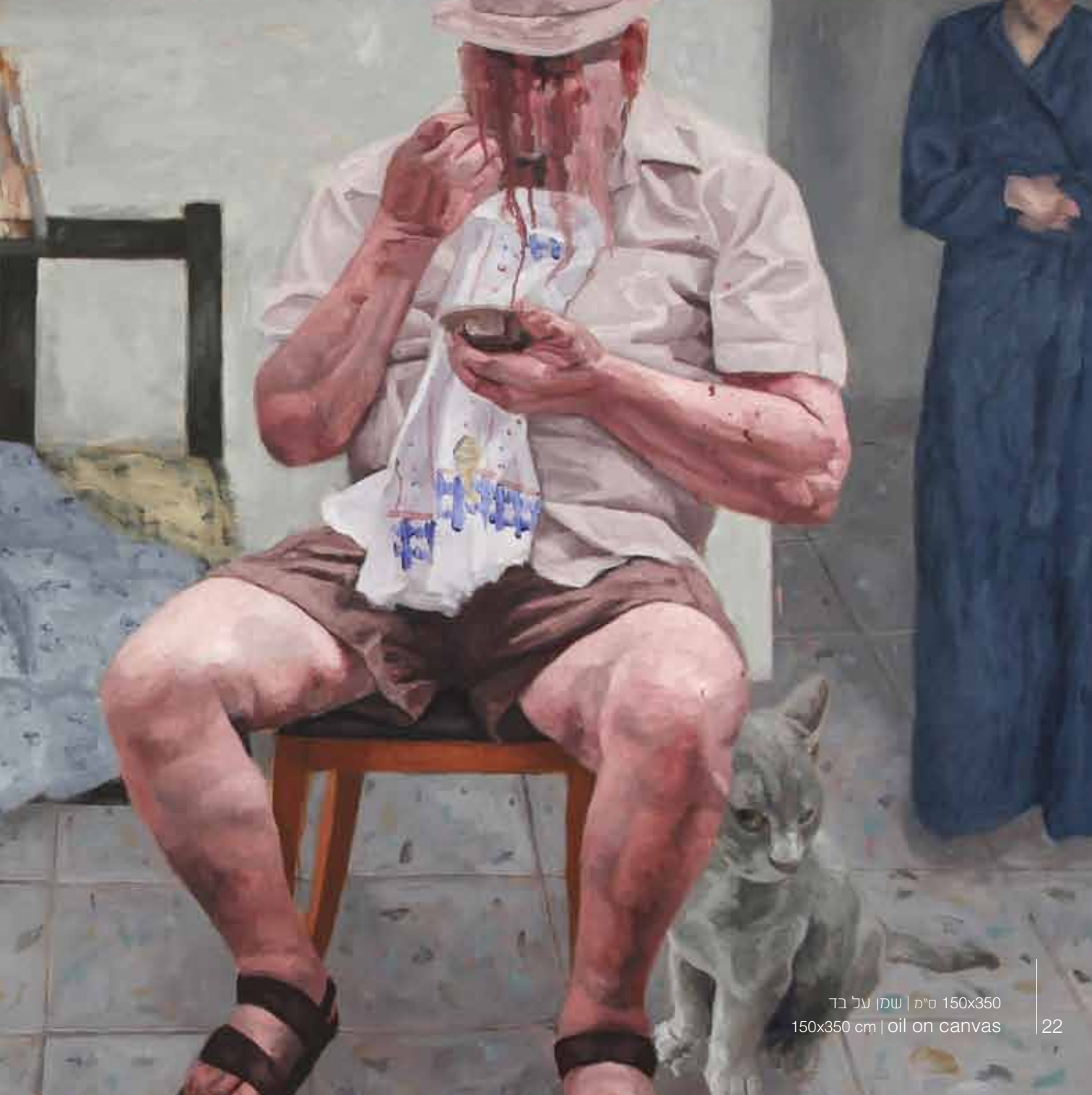
150x350 ס"מ | שמן על בד 150x350 cm | oil on canvas