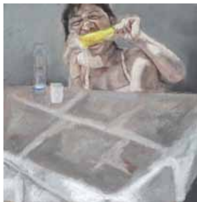
30x30 ס"מ | שמן על בד 30x30 cm | oil on canvas