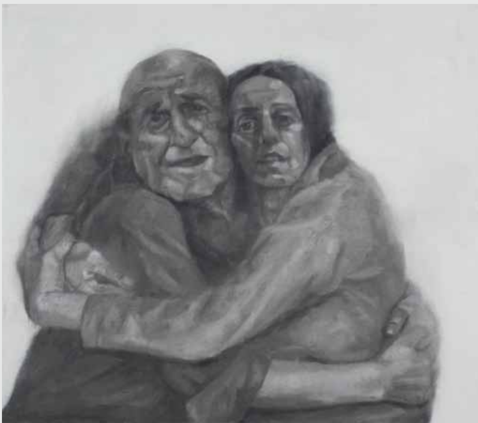
70x80 ס"מ | שמן על בד 70x80 cm | oil on canvas