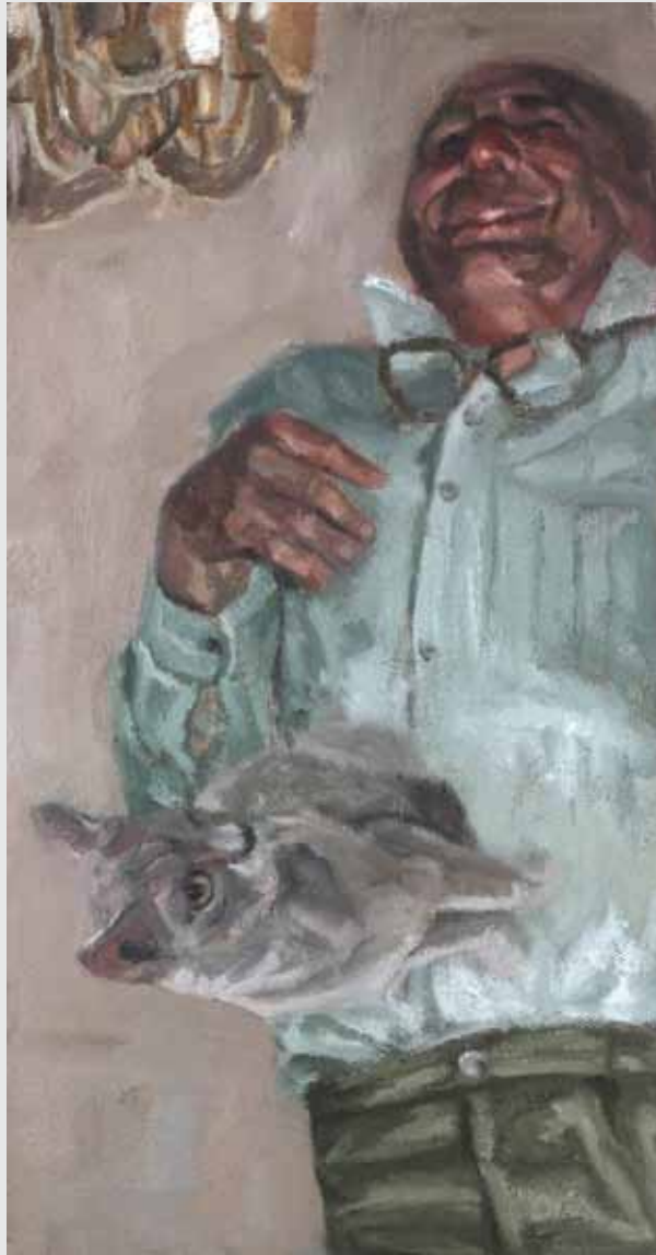
שמון על בד | 47x25 ס"מ 47x25 cm | oil on canvas