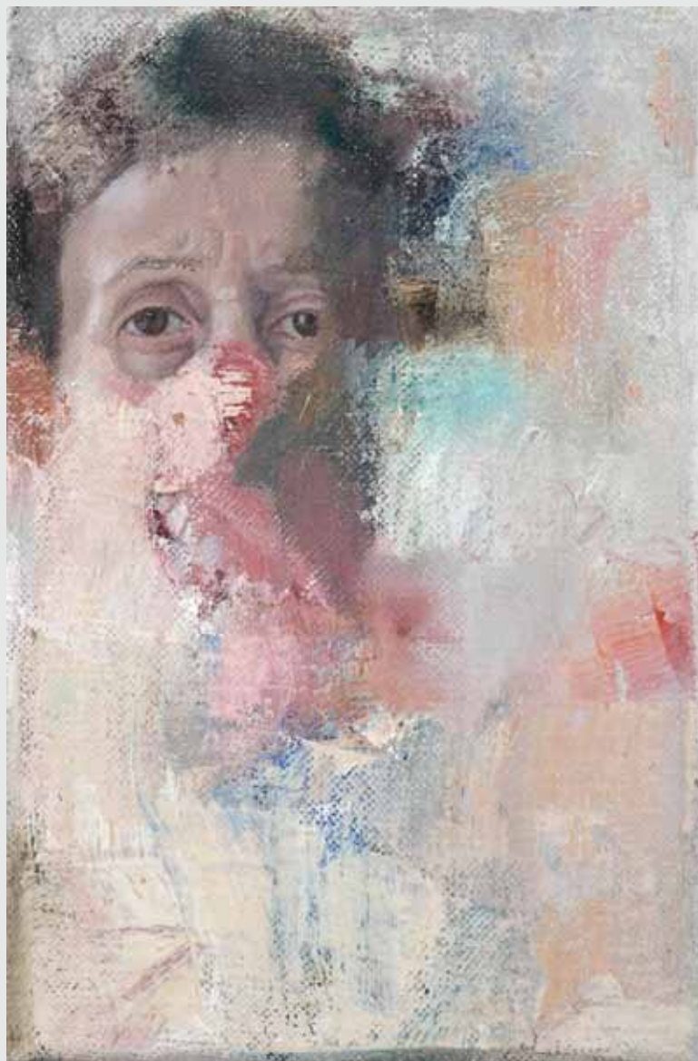
48x33 ס"מ | שמן על בד 48x33 cm | oil on canvas