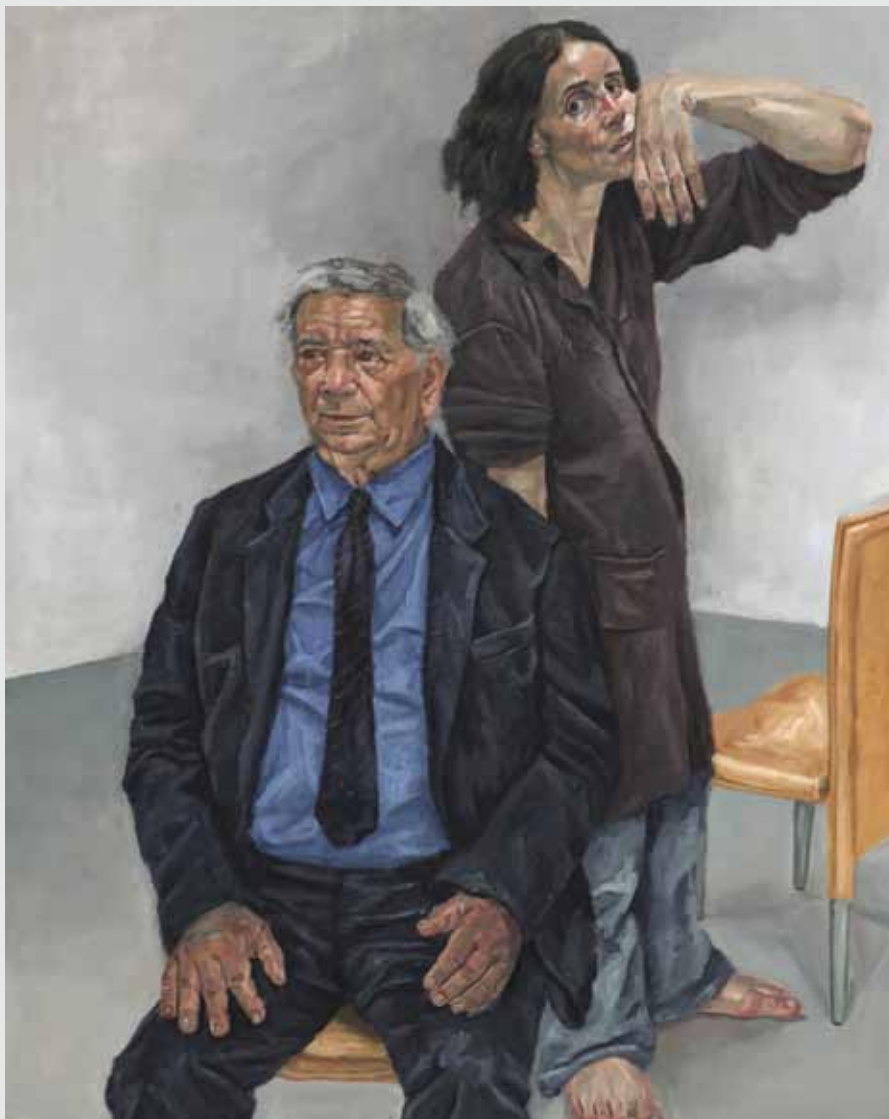
160x130 ס"מ | שמן על בד 160x130 cm | oil on canvas