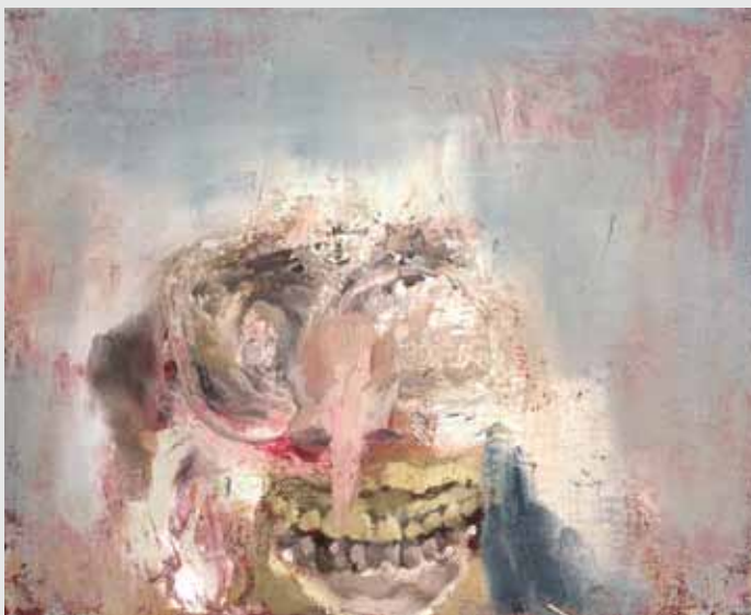
חיוך 24x30 ס"מ | שמן על בד 24x30 cm | oil on canvas