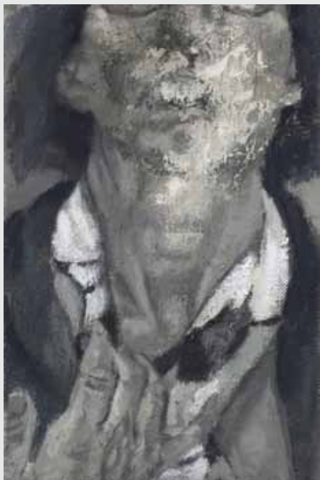
30x20 ס"מ | שמן על בד 30x20 cm | oil on canvas