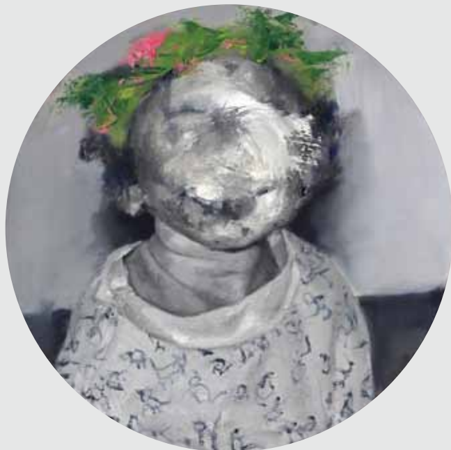
40x40 ס"מ | שמן על בד 40x40 cm | oil on canvas