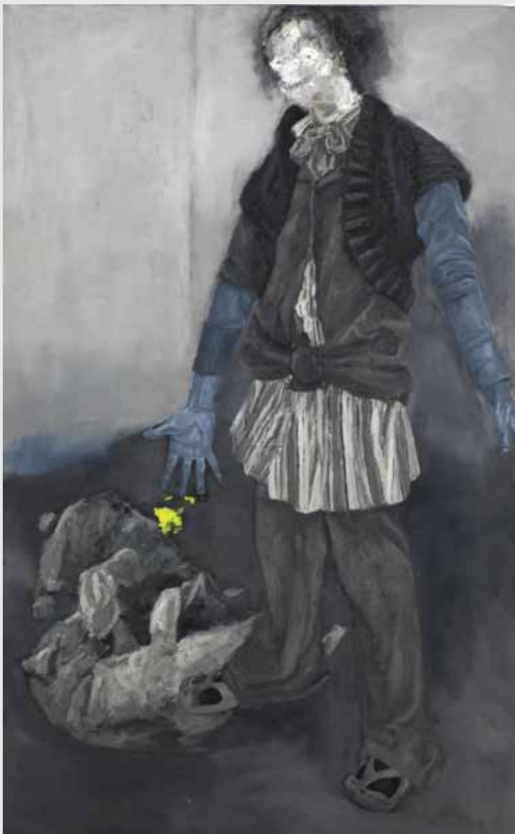
200x125 ס"מ | שמן על בד 200x125 cm | oil on canvas