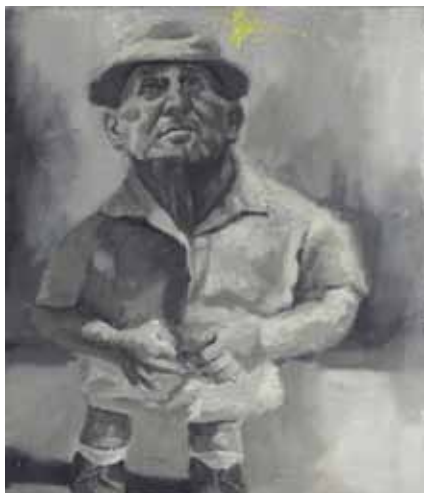
40x35 ס"מ | שמן על בד 40x35 cm | oil on canvas