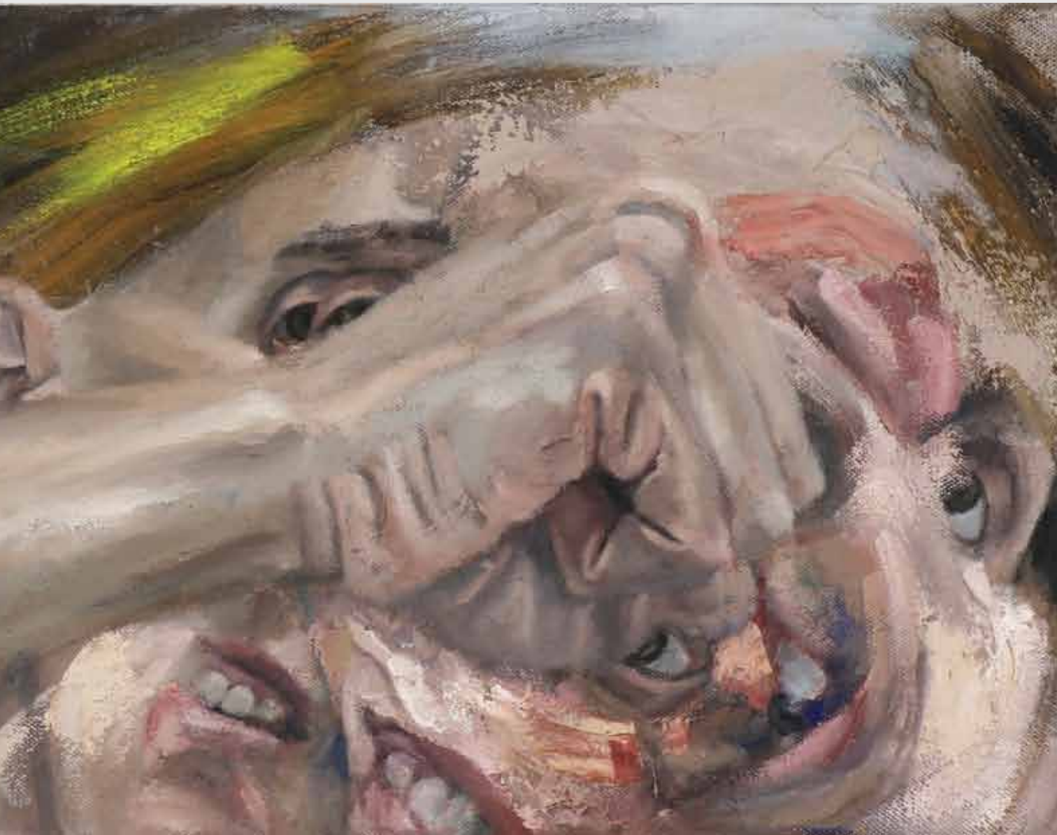
36x92 ס"מ | שמן על בד 36x92 cm | oil on canvas