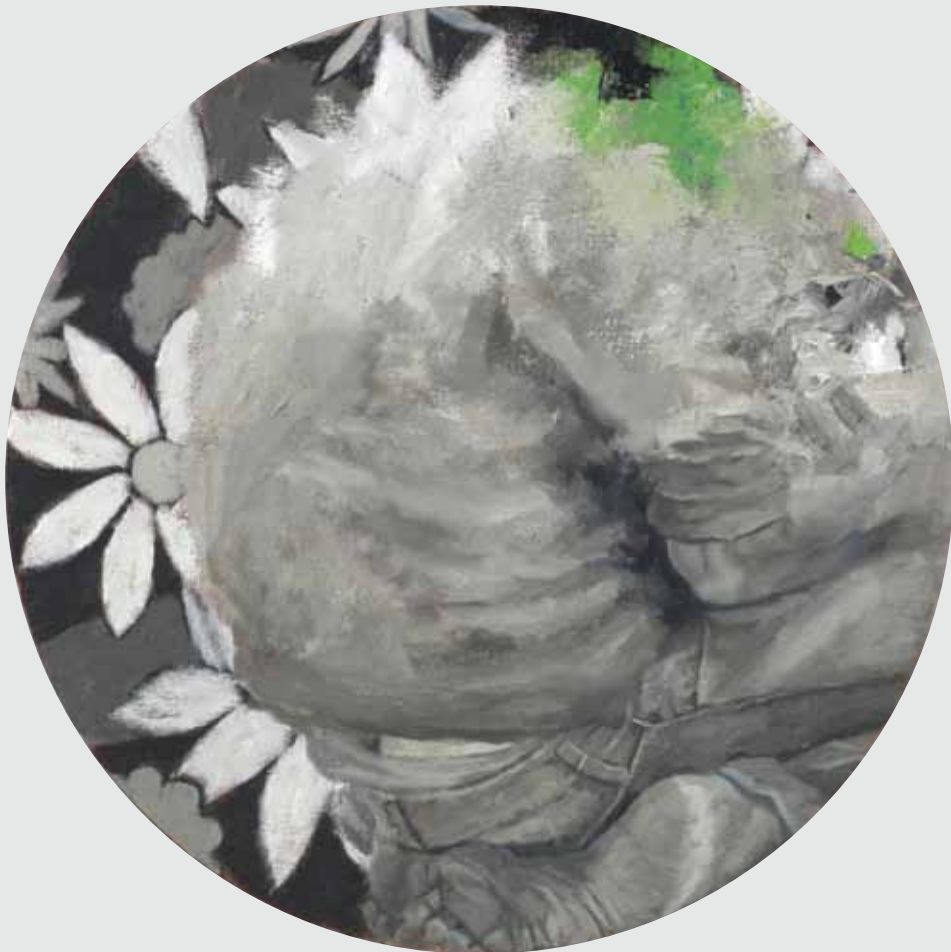
66x66 ס"מ | שמן על בד 66x66 cm | oil on canvas